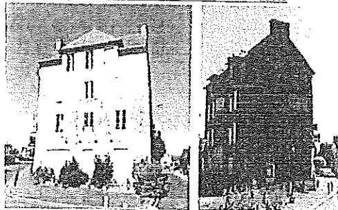
Photographies de l'ancien hôtel de la Poste

La commune de SAINT-CAST LE GUILDO s'est engagée vers de nouveaux objectifs en ce qui concerne le centre-bourg où se situent la mairie et la nouvelle école. Parmi les quatre centralités que présente le tissu urbain de la commune, celle du centre-bourg n'est pas la plus structurée. Les secteurs de l'Isle ou des Mielles présentent des structures urbaines plus développées. De plus, celui des Mielles vit principalement l'été et celui de l'Isle présente un développement très contraint par le manque de terrains disponibles.